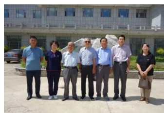
mensen van de organisatie